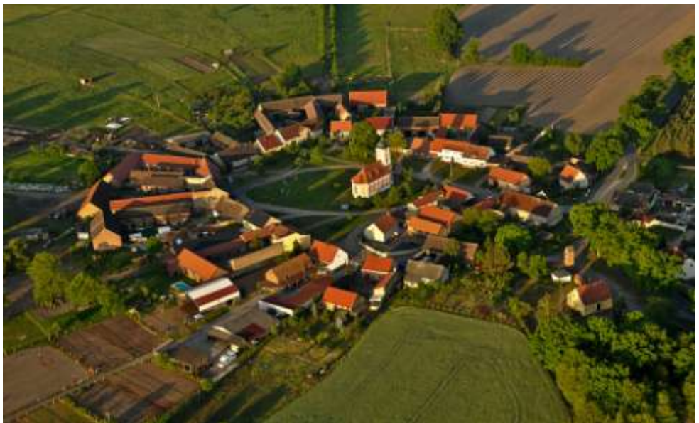
Rundplatzdorf, Runddorf of Rundlingsdorf uit het Wendland

Een soortgelijke oplossing kan gevonden worden voor de zgn. ringdörfer in Oost Duitsland. Ook hier vond missie plaats onder de Wenden door Ierse monniken vanuit Salzburg en ook hier vinden we de opzet van het 'Christelijke dorp'.