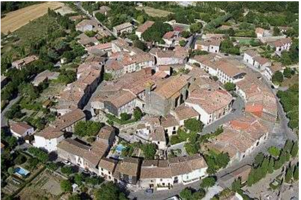
Alairac , in l'Aude